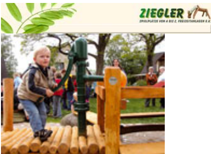
so ähnlich, wird der Spielplatz aussehen

Im Bereich des Kinderplanschbeckens werden wir einen Wasser-Matsch-Spielplatz errichten. Dieses Projekt werden wir voraussichtlich im Herbst 2010 beginnen. Die finanziellen Mittel reichen noch nicht aus den Spielplatz für die Saison 2010 zu errichten.