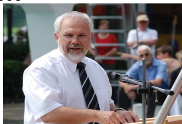
Begrüßung Leonhard Spitzer Bürgermeister