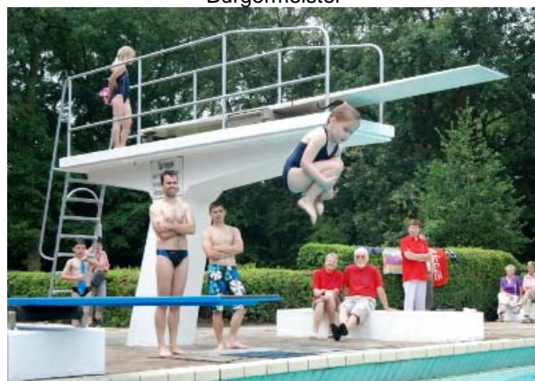
Kunstspringen Duisburger Schwimm- und Sportclub 09/20 e.V.