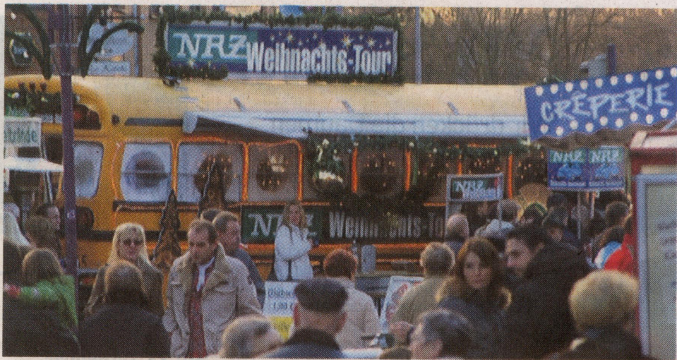
Der NRZ-Weihnachtsbus macht an diesem Samstag Halt in Voerde.