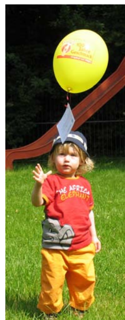
Er freut sich schon auf das neue Planschbecken.