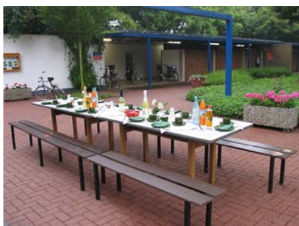
Der Tisch ist gedeckt, die Gäste dürfen kommen

Das Frühschwimmer-Frühstück findet jeden 1. Sonntag im Monat um ca. 8:30 Uhr statt.