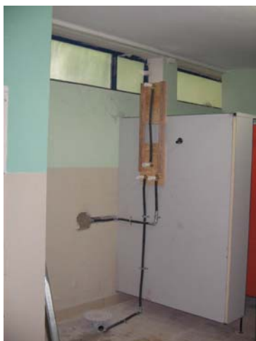
Dusche im Bau befindlich

Eine zusätzliche Warm-Dusche im Innenbereich wurde für unsere Damen und Herren des Freibades kurzfristig vor Saisonbeginn 2006 errichtet.