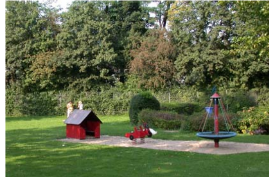
Spielplatz ohne Sonnensegel

Im Bereich des Kinderspielplatzes wurde ein Sonnensegel aufgestellt. Profis des Vereins haben die Planung und Ausführung des Bauvorhabens durchgeführt, von der Baugenehmigung, Statik und Ausführung. Es waren umfangreiche Betonarbeiten erforderlich.