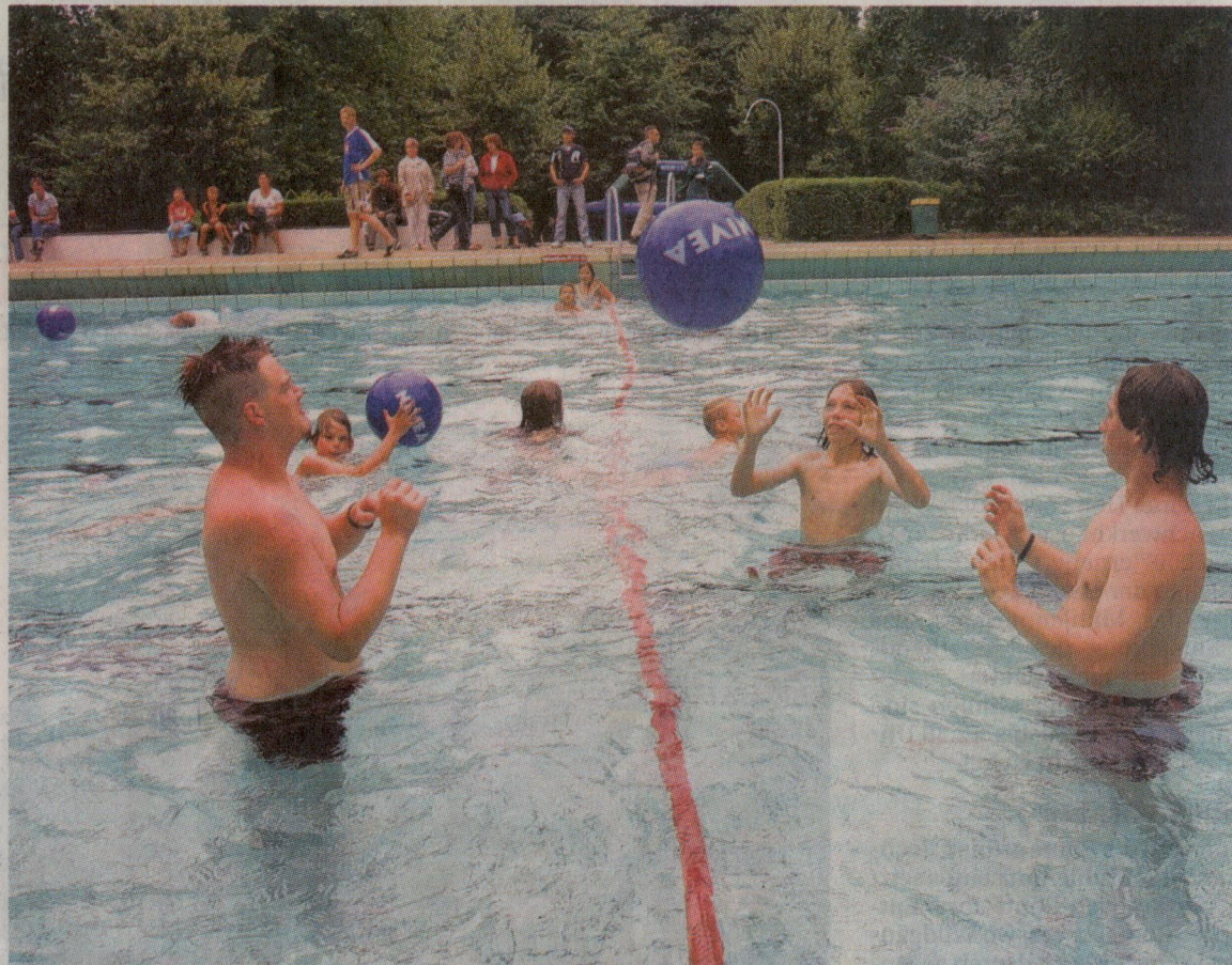
Das Wetter war nicht toll, dafür aber war die Stimmung beim Familientag im Voerder Freibad bei allen Besuchern bestens.